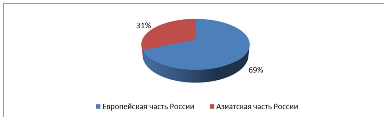
Рис. 2. Структура санаторно-курортных организаций в РФ, 2019 г. Составлено авторами по [7].