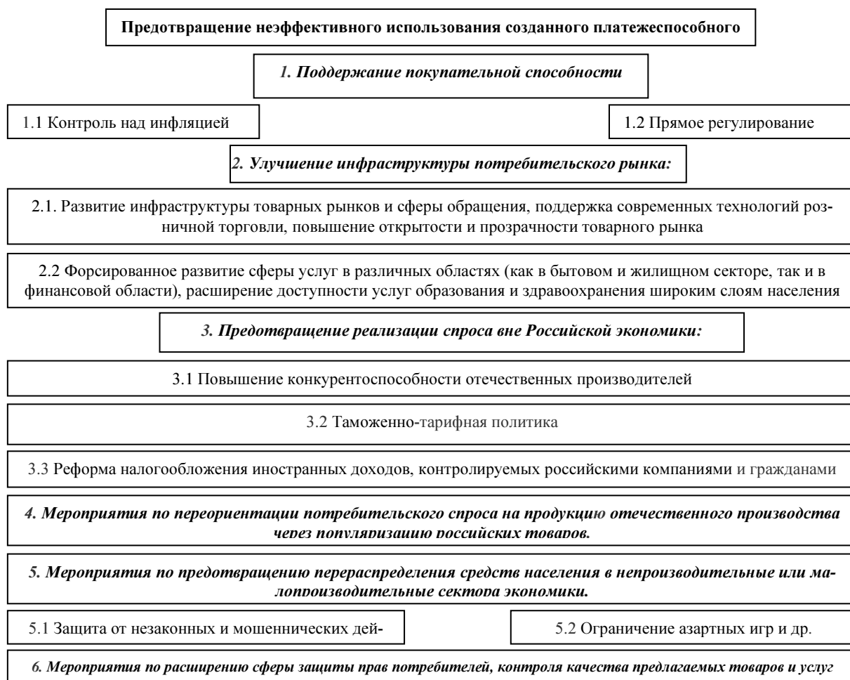
Рис. 3. Предотвращение неэффективного использования созданного платежеспособного спроса.