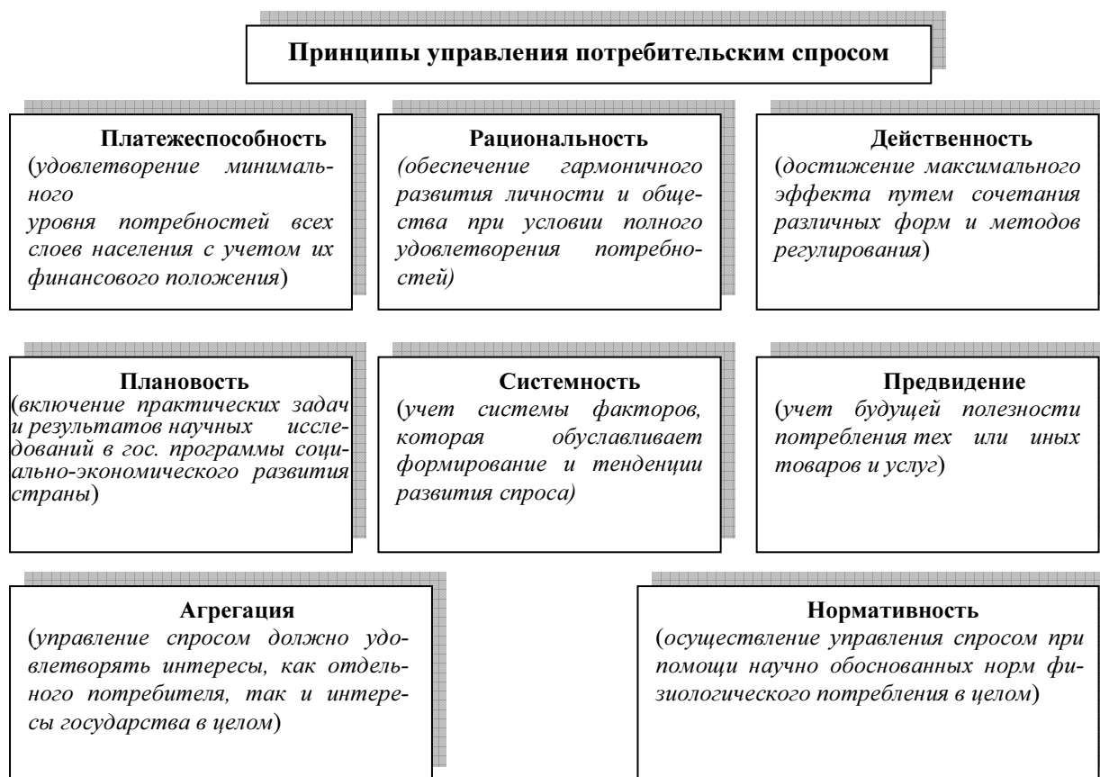
Рис. 1. Принципы управления потребительским спросом.

Современная система регулирования должна основываться на основных принципах управления потребительским спросом, которые приведены на рисунке 1 [2].